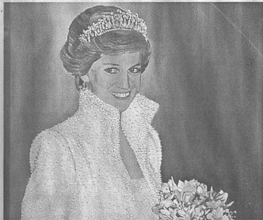
Prinzessin Diana: Als Vorlage dienen ihm Fotos und Bilder.